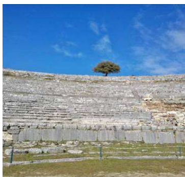
Das Amphitheater, eines der größten in Griechenland