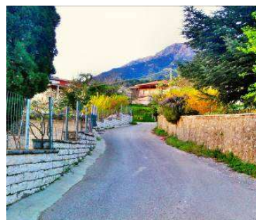
Die kleine Dörfer landen zum Spaziergang ein