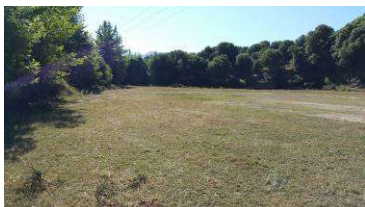
Der große und absolut ebene Platz