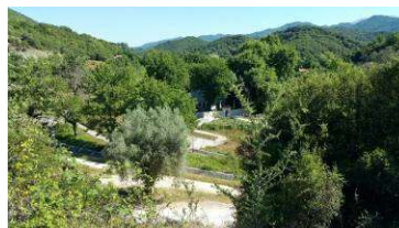
Der Blick vom Platz auf dem Picknickplatz am Fluss Acheron