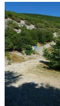
Die „etwas schwierige“ Zufahrt