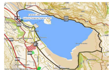
Rundradweg um den See