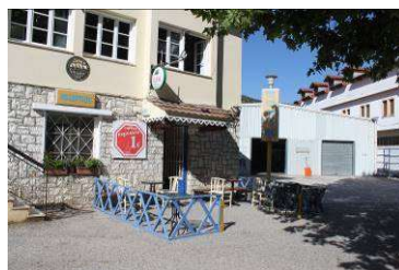
Rezeption mit kl. Einkaufsladen