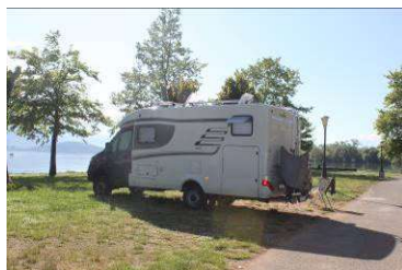
Der Platz mit Blick auf den See